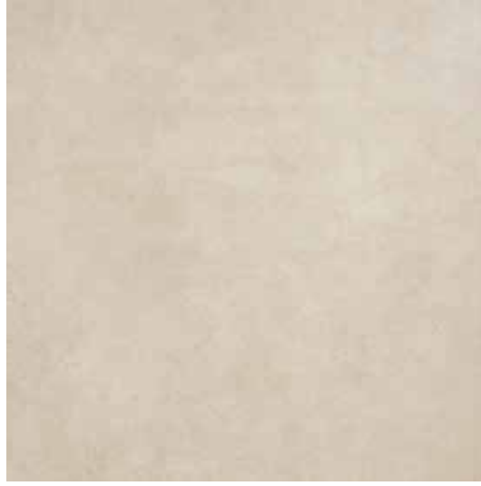
Bej / Beige