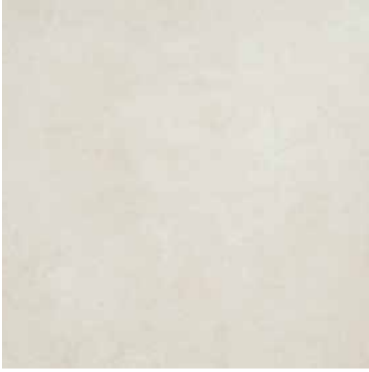
Beyaz / White