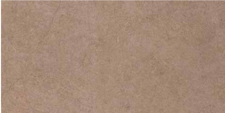
Kahve / Brown