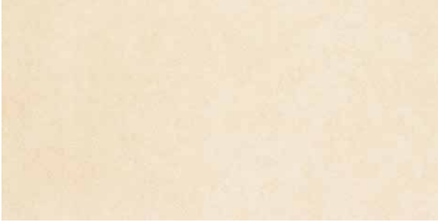
Krem / Cream

* Sadece mat ürünlerde geçerlidir. / Valid only for matt products.