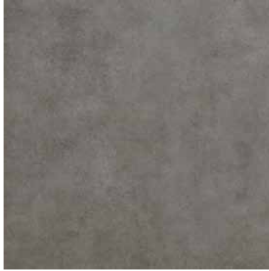
Antrasit / Anthracite

Detaylı bilgi için sayfa 22-24-25'e bakınız. / For detailed information look at page 22-24-25.