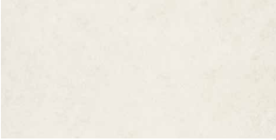
Beyaz / White