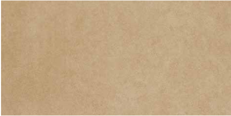
Sarı / Yellow