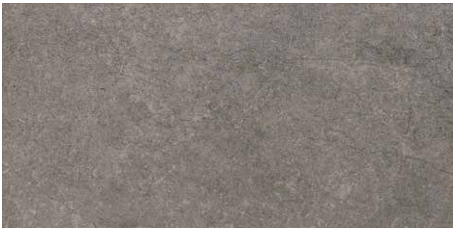
Antrasit / Anthracite

Detaylı bilgi için sayfa 22-24-25'e bakınız. / For detailed information look at page 22-24-25.