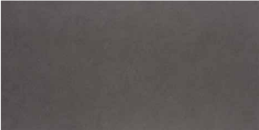
Grafit / Graphite

* Sadece mat ürünlerde geçerlidir. / Valid only for matt products.