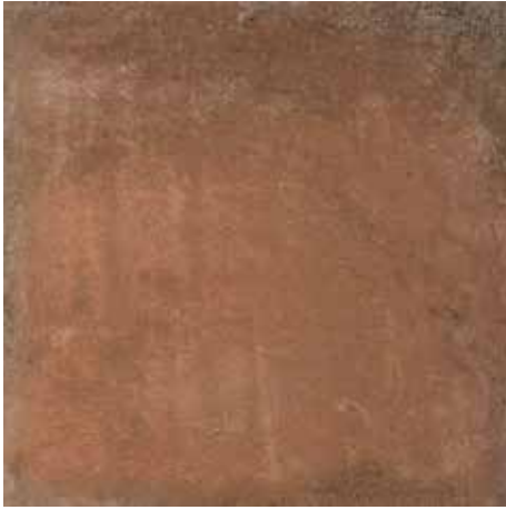
Açık Kırmızı / Light Red