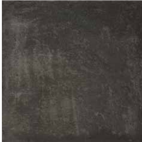
Siyah / Black