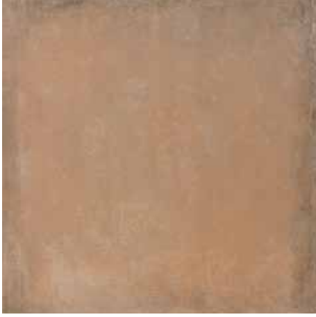
Bej / Beige