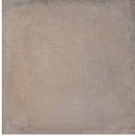
Gri / Grey