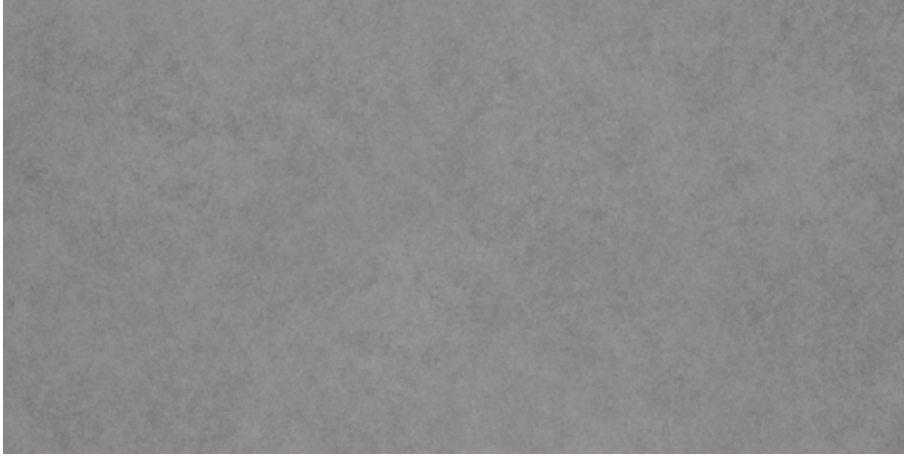
Gri / Grey