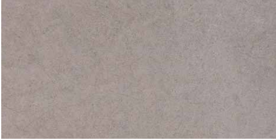
Gri / Grey