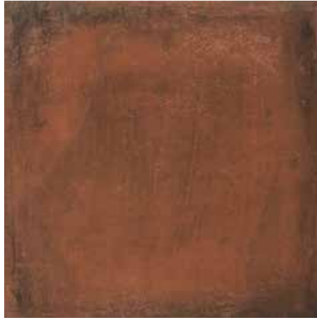
Koyu Kırmızı / Dark Red