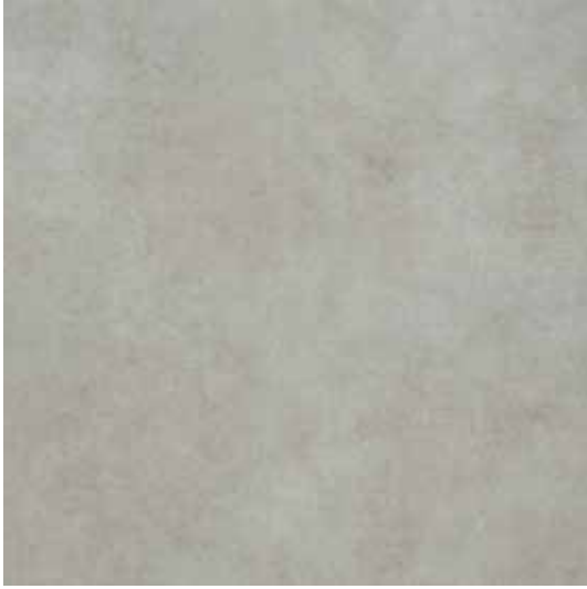
Gri / Grey